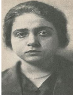
Тереза Гізе (1898-1975)

Тереза Гізе, німецька актриса, стала першою виконавицею головної ролі в п'єсі Брехта «Матінка Кураж та її діти» на сцені одного з найвідоміших театрів у Швейцарії «Шаушпільхауз» (1941).