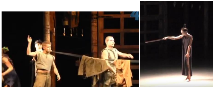
Пластична драма «Матінка Кураж та її діти» на сцені Київського молодіжного театру

Пластичну драму «Кураж», поставив режисер Київського молодіжного театру Олексій Склярєнко, в якій актори мовою хореографії та пластики представили образ жінки, що йде крізь війну. Режисер наголосив, що намагався створити стоїчний міцний образ жінки в протиставленні збірному образу війни, долі та смерті.