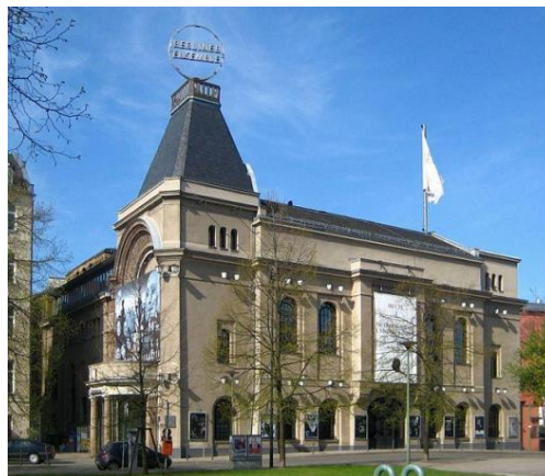
Драматичний театр у Берліні «Берлінер-ансамбль», заснований Б.Брехтом у 1948 р.