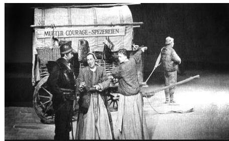
Хелена Вайгель у ролі Матінки Кураж. 1949 р.