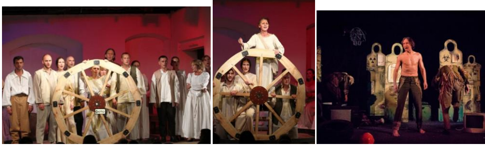
Вистава «Матінка Кураж та її діти» Чернігівського Молодіжного театру

З великим успіхом ставлять «Матінку Кураж» і на українській сцені.