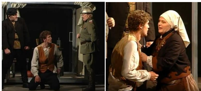
«Матінка Кураж та її діти» на сцені Івано-Франківського академічного обласного музично-драматичного театру імені Івана Франка (режисер Мирослав Гринишин). 2009 р.