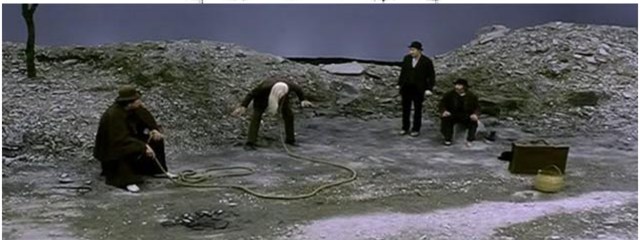
Кадр із кінофільму «Чекаючи на Годо» (режисер М. Ліндсей-Хогг, Ірландія, 2001)