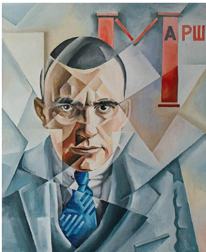
В. Коротков. Портрет Маяковського. 2012

Термін «кубофутуризм» виник із назв двох живописних напрямків: французького кубізму та італійського футуризму. Митці-кубісти розкладали предмети і фігури, створюючи нові конструкції. Футуристи проголошували руйнування усіляких конструкцій.